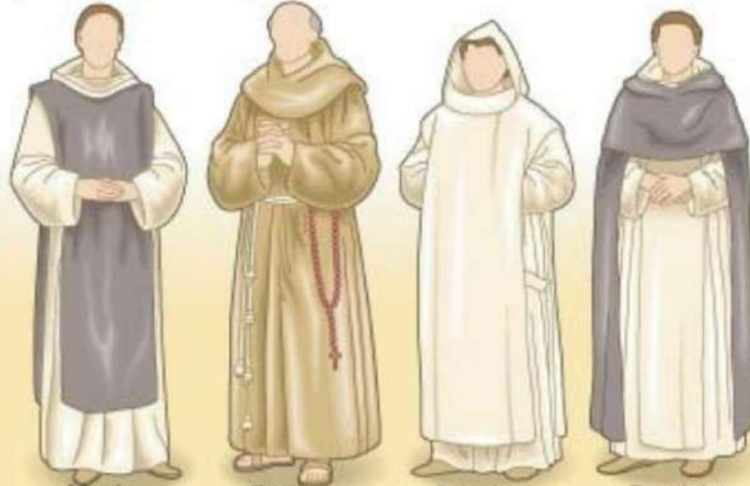
▲ Monje cisterciense

Luego del concilio de Trento, un nuevo espíritu invadió las órdenes religiosas, que se convirtieron en difusoras de los acuerdos alcanzados en este concilio ecuménico. Los trapenses (cistercienses reformados) renovaron en 1600 la vida monástica. Los franciscanos -al igual que los jesuitas- se convirtieron en activos misioneros. Los cartujos predicaron con su ejemplo de austeridad, contemplación y vida de ermitaños. Los dominicos, dedicados al estudio, la predicación y la enseñanza, tuvieron un papel importante en la Inquisición.